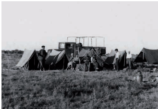
Рис. 2. ЮКАЭ-1949. Археологический лагерь на Сырдарье, ур. Каинда-Тогай. Крайний справа у палатки – И.И. Копылов