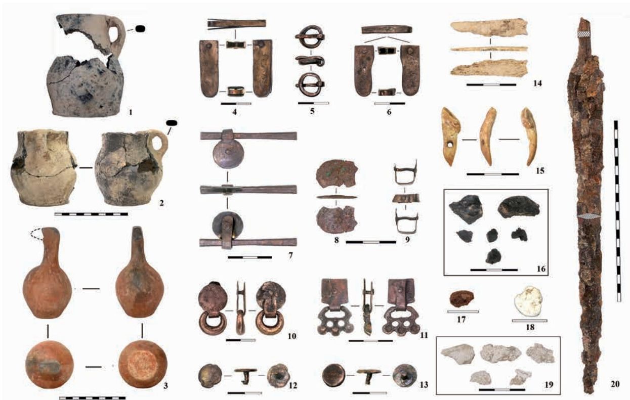
Рис. 2. Могильник Кызылколь 1 (западная группа курганов). Археологический комплекс наземного склепа 9 2-сур. Кызылкөл 1 қорымы (батыс обалар тобы). № 9 жерүсті сағанасының археологиялық кешені Fig. 2. Kyzylkol 1 burial ground (western group of mounds). Archaeological complex of above-ground crypt 9

Изделия из металла представлены гарнитурным набором блях, пряжек, подвесок, «псевдо-подвесок» и пронизью к узкому кожаному поясу из бронзы, а также железным кинжалом.