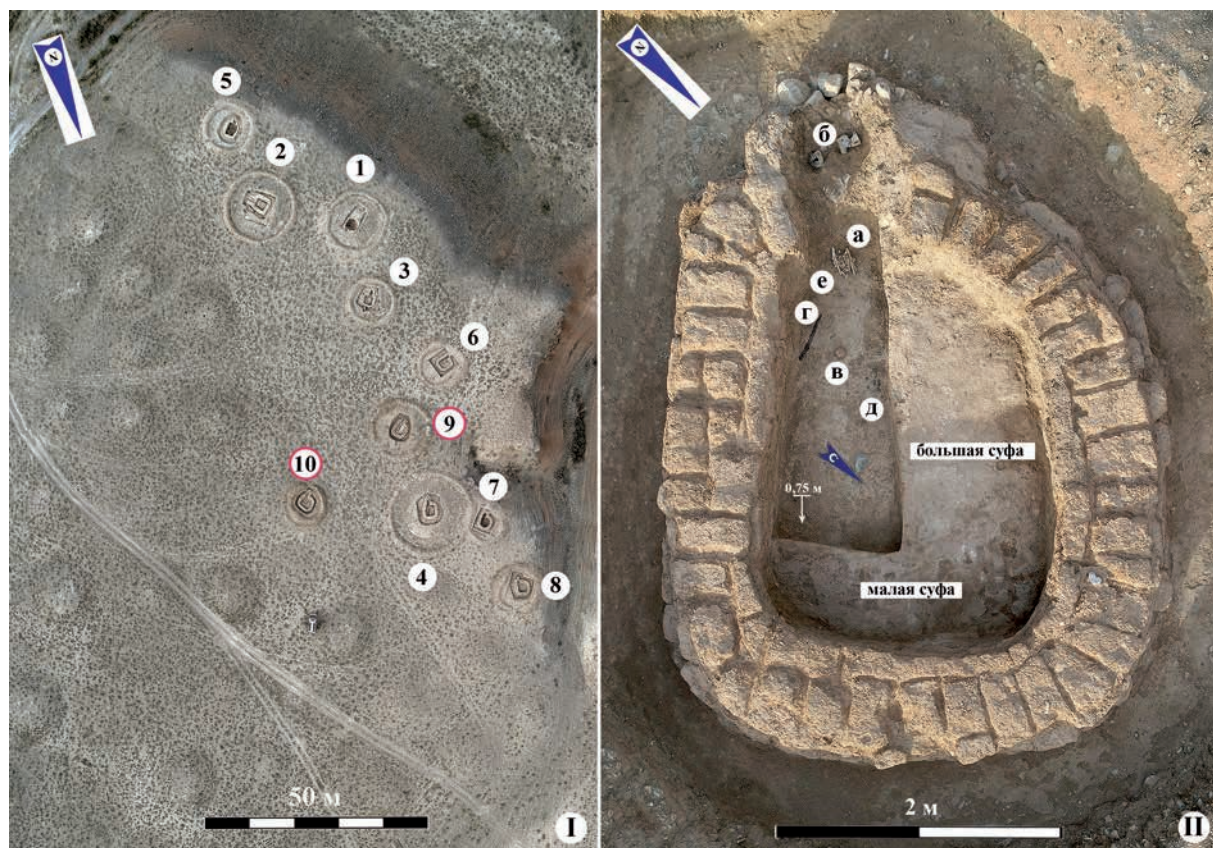
Рис. 1. Могильник Кызылколь 1 (западная группа курганов): I – вид сверху и маркировка исследованных курганов; II – наземный склеп 9 (вид сверху и экспликация инвентаря)

Кызылколь 1 (западная группа насыпей). Могильник состоит из 66 курганов, он находится на невысокой плоской площадке неправильной трапециевидной формы размерами 150×240×120×180 м правой надпойменной террасы безымянного ручья, вблизи его впадения в реку Ушбас, у подножия южного окончания языкового выступа из неогеновых глин красного цвета (рис. 1.1)* (*Все фото выполнены и подготовлены авторами). Относится к могильникам с бессистемным расположением насыпей, которые сложены из небольших камней, мелкого щебня и грунта; при этом практически все курганы этого могильника носят следы ограбления в древности. Профили насыпей, в целом, фиксируются хорошо, но есть курганы с сильно оплывшими склонами и почти нерельефной насыпью. Средние размеры насыпей: диаметр основания 18–12, 12–20 м, высота 0,4–0,6–1,9 м.