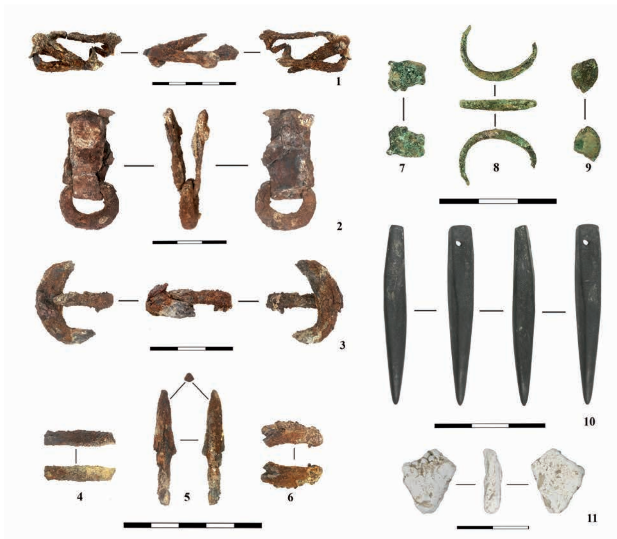
Рис. 4. Могильник Кызылколь 1 (западная группа курганов). Археологический комплекс наземного склепа 10

4-сур. Қызылкөл 1 қорымы (батыс обалар тобы). № 10 жерүсті сағанасының археологиялық кешені Fig. 4. Kyzylkol 1 burial ground (western group of mounds). Archaeological complex of above-ground crypt 10