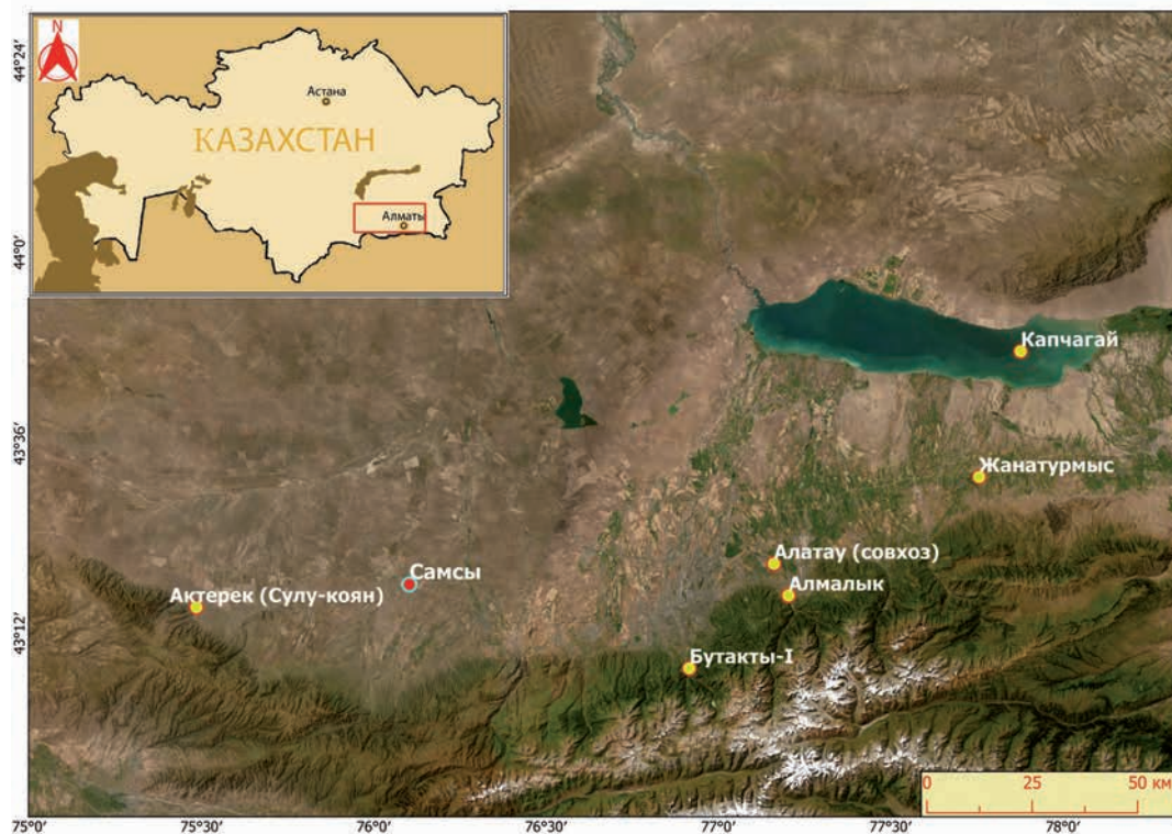
Рис. 1. Карта расположения тюркских погребений с конем в Шу-Иле. Исполнитель: Мамбет Шагирбаев 1-сур. Шу-Иледегі жылқымен бірге түркілік жерлеулердің орналасу картасы. Орындаған: Мәмбет Шағырбаев Fig. 1. Map of the location of Turkic burials with a horse in Shu-Ile. Performer: Mambet Shagirbayev

Костные остатки шести лошадей получены из четырёх курганов (№ 1, 3, 4, 17) памятника Самсы (рис. 2). В каждом кургане лошади положены целыми (№ 4 и 17) или отдельными частями (№ 1 и 3). В кургане № 4 вместе с целым скелетом были найдены останки ещё одной особи без