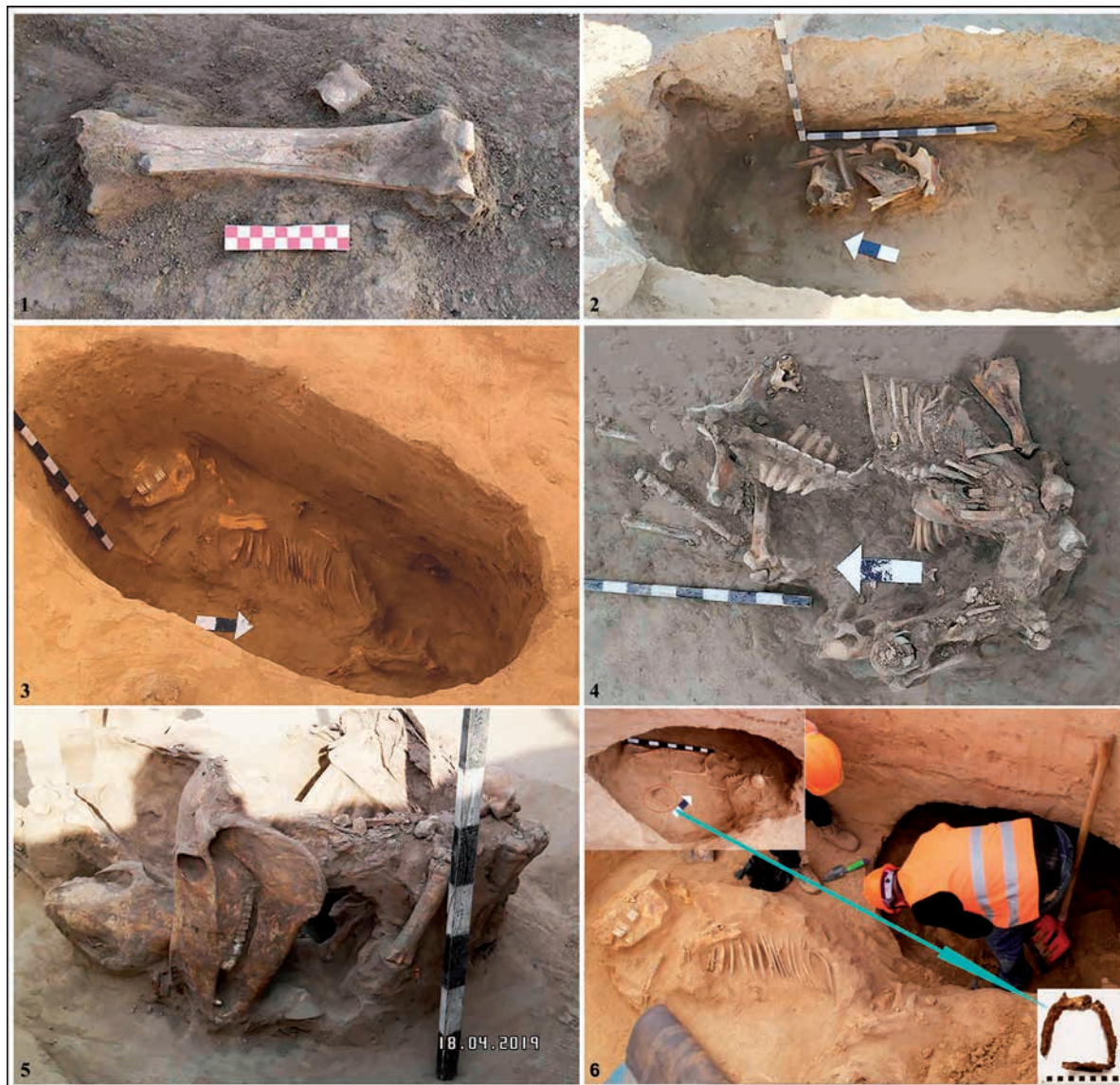
Рис. 2. Костные останки лошадей памятника Самсы: 1 – к. 1; 2 – к. 3; 3 – к. 4; 4-5 – к. 17; 6 – к. 4 2-сур. Самсы ескерткішіндегі жылқының сүйек қаңқалары: 1 – № 1 оба; 2 – № 3 оба; 3 – № 4 оба; 4-5 – № 17 оба; 6 – № 4 оба

череп. В кургане № 17 был выявлен целый скелет и череп без нижней челюсти с элементами посткраниального скелета второй лошади. По каждой особи составлено описание возрастных и половых признаков (при наличии сохранённого черепа и его элементов), морфологических особенностей костей скелета, патологических изменений и определён сезон гибели некоторых особей. Морфометрическое описание костей проводилось по общепринятой методике [Eisenmann et al. 1988]. Тип черепов был анализирован по методике В.И. Цалкина [Цалкин 1952: 148–152]. Возрастной состав животных определён по состоянию щечных зубов – смене молочных зубов на