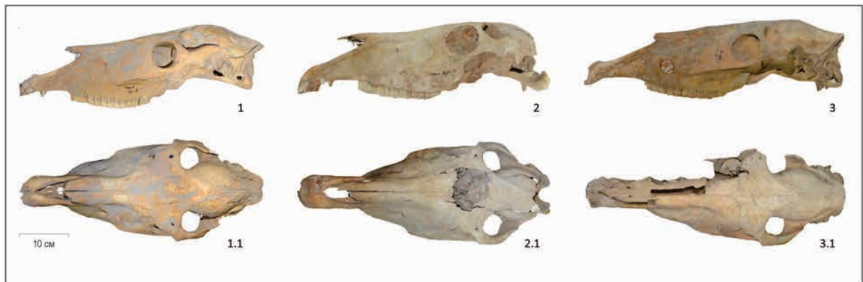
Рис. 3. Черепа лошадей: 1-2 – к. 17; 3 – к. 3. 1–3 – вид с боку* (*обратите внимание на различия в форме профиля лобно-носового отдела черепа); 1.1–3.1 – вид сверху. Выполнил: Каиржан Исаков 3-сур. Жылқылардың бас сүйектері: 1-2 – №17 оба; 3 – №3 оба. 1–3 – жанынан қарағандағы көрініс* (*бас сүйектердің маңдай-мұрын пішініндегі айырмашылықтарға назар аударыңыз); 1.1–3.1 – үстінен қарағандағы көрініс. Орындаған: Каиржан Исаков

Fig. 3. Horse skulls: 1-2 – m. 17; 3 – m. 3. 1–3 – side view* (*pay attention to the differences in the shape of the profile of the frontal-nasal part of the skull); 1.1–3.1 – view from the top. Performer: Kairzhan Iskakov