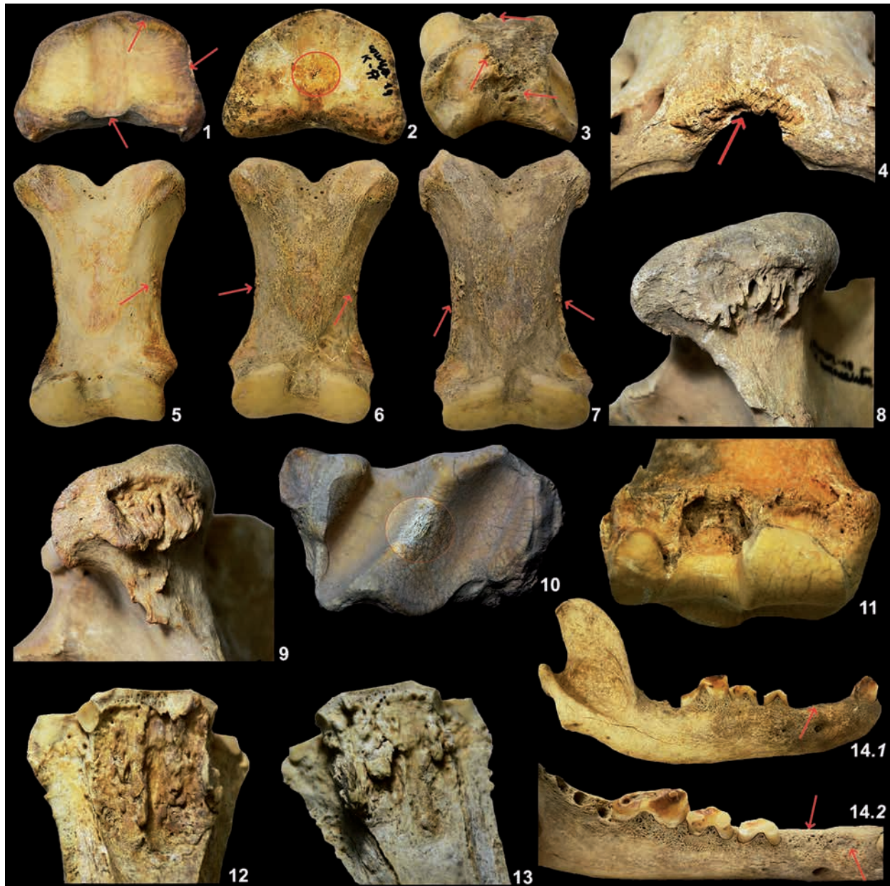
Рис. 4. Патологические изменения скелетных элементов лошади и собаки: 1 – расширения суставной поверхности первой фаланги лошади из кургана № 3; 2 – проксимальный сустав первой фаланги лошади из кургана № 17. В центре сагиттального желобка имеется паутинообразные трещины (переломы?); 3 – костные экзостозы на дорсальной поверхности второй (задняя/левая) фаланги лошади из кургана № 1; 4 – остеонекроз на дорсальной бугорке атланта лошади из кургана № 1; 5–7 – боковые остеофиты у первых фаланг лошадей из кургана № 1; 8–9 – невоспалительные изменение надкостницы (периостоз) под латеральной мышелки большеберцовых костей лошадей из курганов № 1 и № 17; 10 – поражение на поверхности гребня дистального блока большеберцовой кости лошади из кургана № 1; 11 – остеонекроз и эрозирование периартикулярной ткани (энтезит) лучевой кости лошади из кургана № 17; 12–13 – поражение костной ткани пальмарной поверхности пястных костей лошади из кургана № 3; 14.1 – прижизненная потеря первого и второго премоляра без свидетельств воспалительного процесса на нижней челюсти собаки из кургана № 1; 14.2 – нижняя челюсть собаки, вид сверху