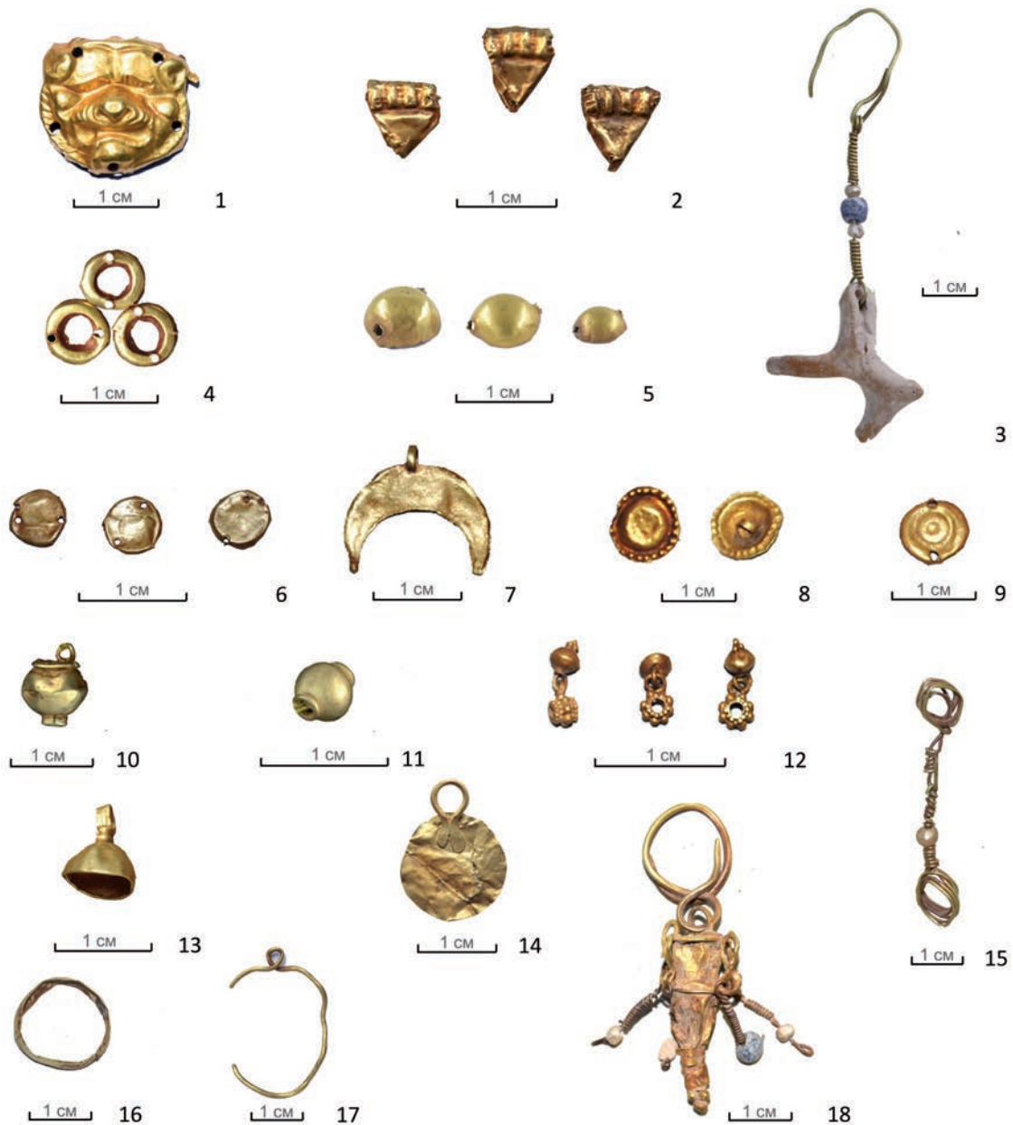
2-сур. Шірікратат мәдениеті ескерткіштерінен табылған алтын зергерлік бұйымдары: 1, 2, 4–6, 8–10, 14 – жапсырмалар; 3, 17, 18 – сырғалар; 7, 12, 13, 15 – салпыншақтар; 11 – моншақ; 16 – сақина. Fig. 2. Gold jewelry from the sites of the Shirikrabat culture: 1, 2, 4–6, 8–10, 14 – plaques; 3, 17, 18 – earrings; 7, 12, 13, 15 – pendants; 11 – a bead; 16 – a ring.