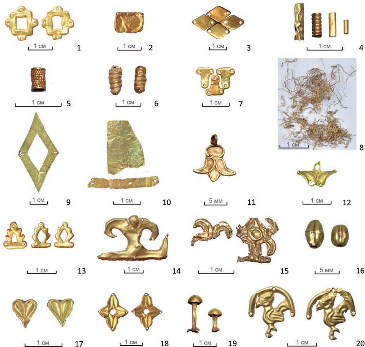
3-сур. Шірікрат мәдениеті ескерткіштерінен табылған алтын зергерлік бұйымдар: 1–3, 7, 9, 10, 13–15, 17, 18, 20 – жапсырмалар; 4–6 – үзбелер; 8 – сым; 11, 12 – салпыншақтар; 16 – моншақтар; 19 – қапсырма.

Fig. 3. Gold jewelry from the sites of the Shirikrabat culture: 1–3, 7, 9, 10, 13–15, 17, 18, 20 – plaques; 4–6 – pierces; 8 – wire; 11, 12 – pendants; 16 – beads; 19 – a rivet.