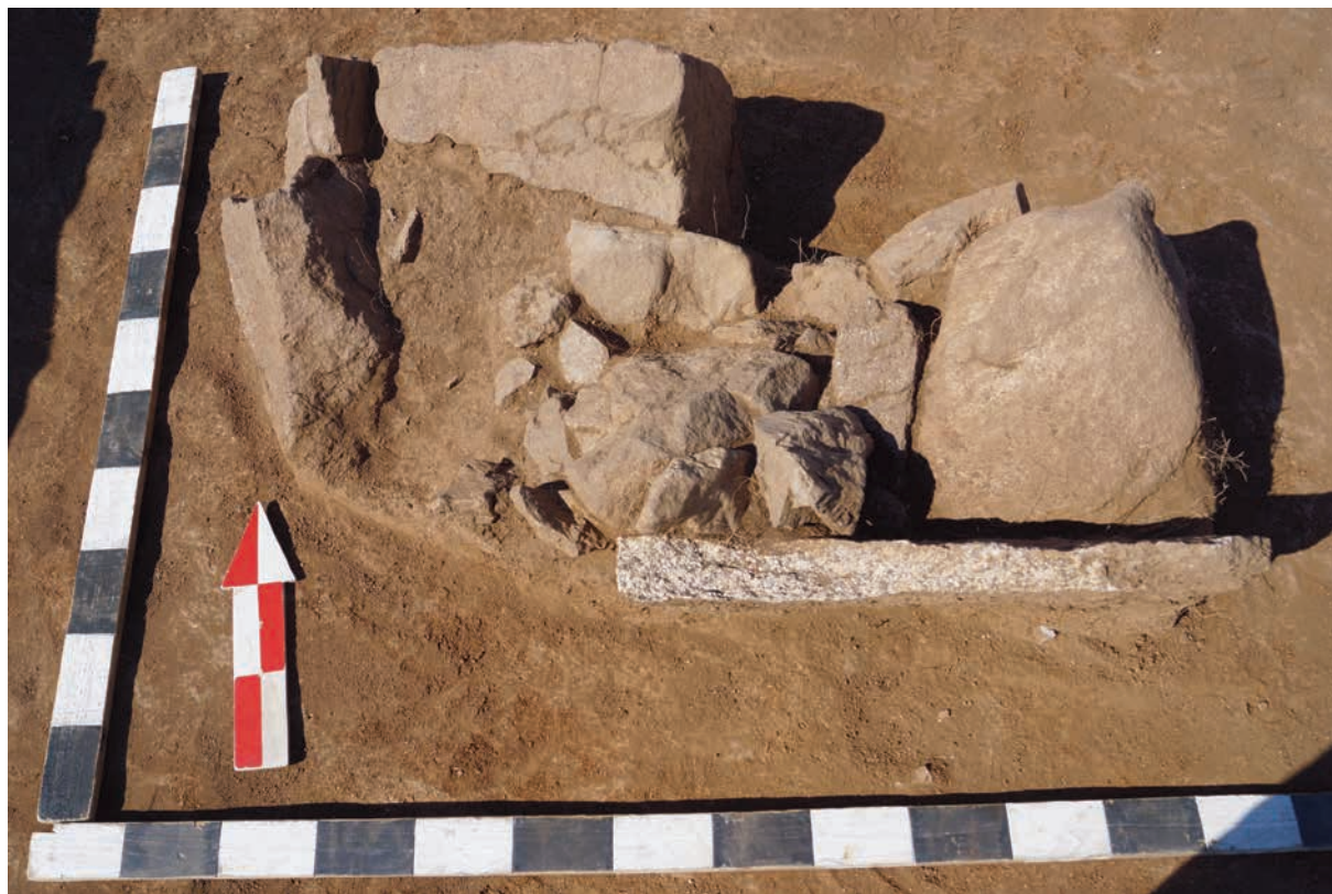
Рис. 3. Комплекс Жанажұрт. Скопление камней и плита в центральной части сооружения № 1 3-сур. Жаңажұрт кешені. № 1 құрылыстың орталық бөлігінде тастар мен плиталардың жиналуы Fig. 3. Zhanazhurt complex. Stone accumulation and a slab in the central part of structure no. 1

сти. После снятия слоя дёрна, расчистки камней и стенок объекта было установлено, что ограда относится к разновидности многоплитных. Её размеры с учётом развала стенок составили 4.2×3.8 м. Сооружение было ориентировано стенками по сторонам света. Северная стенка ограды достигала в длину 3 м и состояла из трёх плит, слегка наклонившихся наружу. С внешней стороны она была укреплена средними и мелкими по размеру камнями. Размеры плит стенки составили 0.85–1.3×0.35–0.37×0.09–0.1 м. Западная стенка ограды была длиной 3.25 м и состояла из двух плит, слегка наклоненных наружу. Размеры плит составили 1.6–1.65×0.4–0.45×0.09–0.1 м. Восточная стенка длиной 3.2 м состояла из двух завалившихся наружу плит размерами 0.7–2.5×0.4–0.45×0.08–0.1 м и была укреплена снаружи в нескольких местах крупными плитками. Южная стенка имела длину 2.7 м. Она состояла из двух сильно наклонившихся наружу плит, одна из которых была продольно обломлена. Размеры плит составили 0.5–2.2×0.35–0.6×0.09–0.1 м. Внутреннее пространство ограды было заполнено камнями в несколько слоёв до уровня материка. В ходе исследования объекта находок не обнаружено. Реконструируемые первоначальные размеры сооружения составляют около 3.2×3.0 м. По окончании раскопок была осуществлена рекультивация объекта.