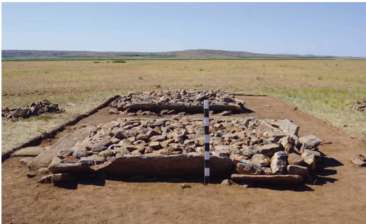
Рис. 2. Комплекс Жанажурт. Фото оград (с севера) 2-сур. Жаңажұрт кешені. Қоршаулардың фотосуреті (солтүстіктен) Fig. 2. Zhanazhurt complex. Photo of fences (from the north)