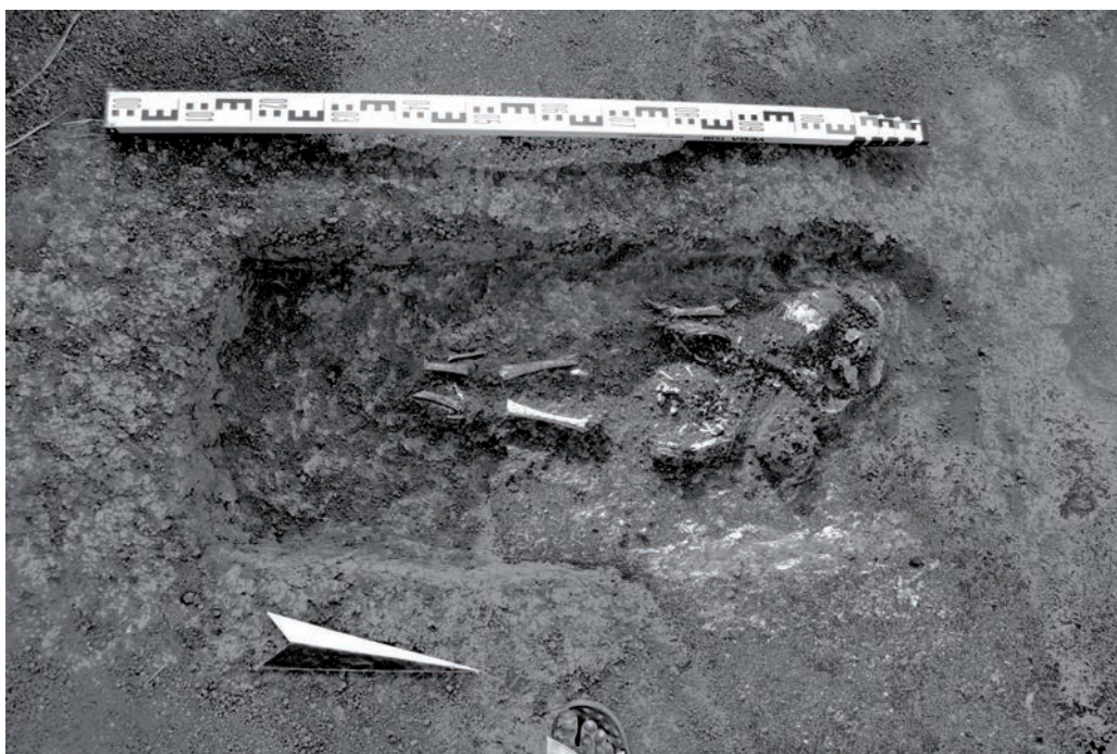
Рис. 4. Бирский грунтовый могильник. Погребение 329. Фото: Рида Русланова 4-сур. Бирск топырақ қорымы. № 329 жерлеу орны. Фото: Рида Русланова

В декабре 2020 г. в лаборатории Дэвида Райха кафедры генетики Гарвардской медицинской школы (Бостон, Массачусетс, США) были получены результаты секвенирования геномов для 4-х индивидов из Бирского могильника 2017 г. раскопок (пп. 694, 702, 710, 713), для которых были доступны сохранные зубы. В результате был определён пол и гаплогруппы для двух индивидов (п. 694 – мужчина, п. 713 – женщина), получены генотипы во множественных локусах на аутосомах. Также