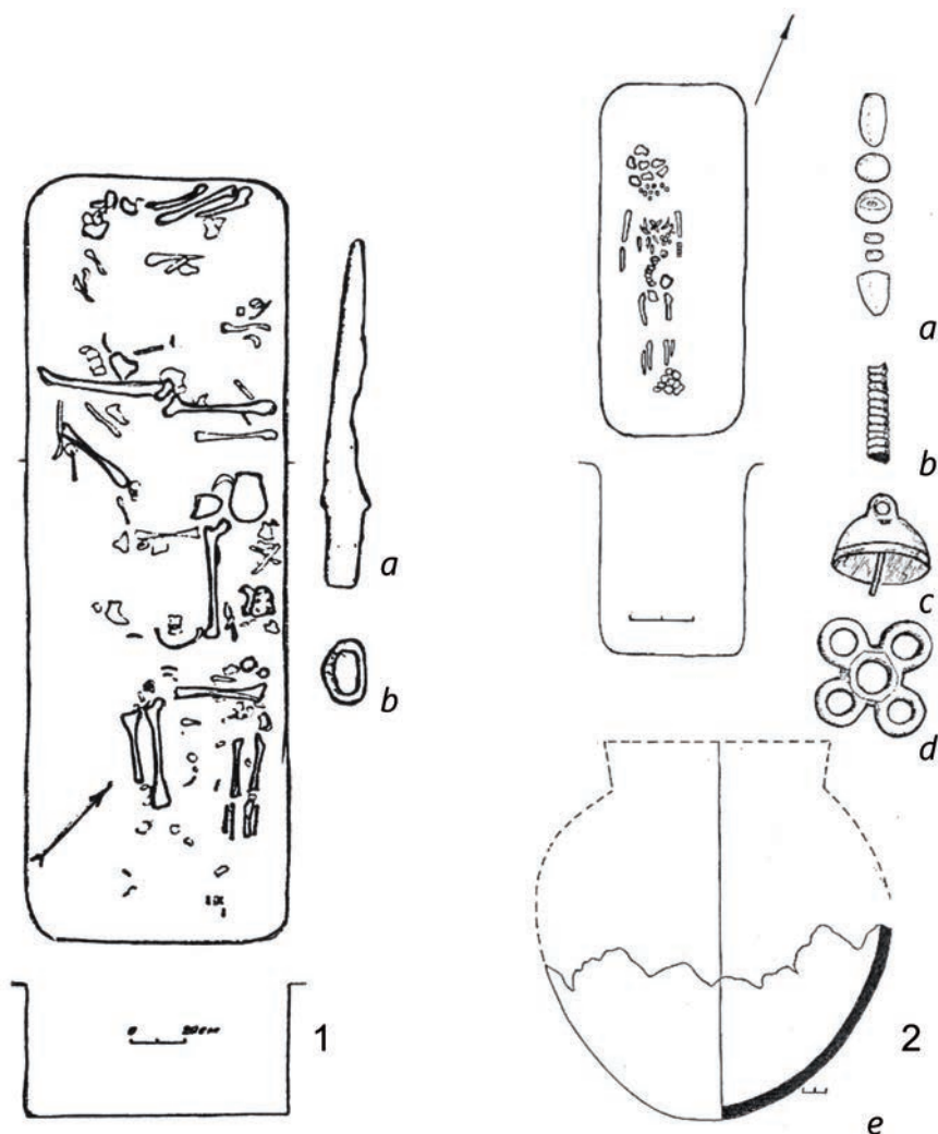
Рис. 2. Бирский грунтовый могильник: 1 – погребение 316 (а – железный нож; б – рамка от пряжки); 2 – погребение 408 (а – бусины; б – пронизка; с – колоколовидная подвеска; d – розетковидная подвеска; e – сосуд) (по: [Мажитов 1981; 1984])

Из выделенных 60 погребений 52 одиночных, восемь костяков размещались в коллективных захоронениях: три погребения содержало скелеты взрослого и ребёнка (пп. 150, 560, 680), в трёх зафиксированы двое взрослых и ребёнок (пп. 462, 612, 613). Выявлено одно захоронение, содержащее скелеты трёх взрослых и ребёнка (п. 316, рис. 2, 1) и одно, состоящее из двух взрослых и двух детей (п. 515).