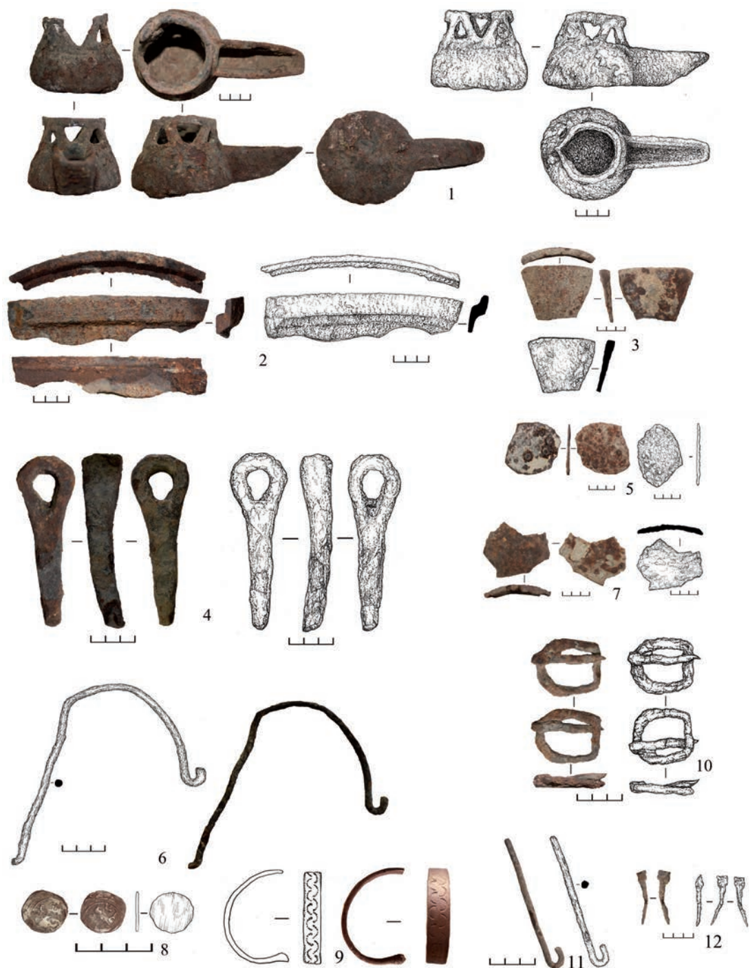
5-сур. Қоныстан табылған метал бұйымдар. Суретті дайындаған Г.Т. Әмірғалина мен А.Ж. Назаров

Fig. 5. Metal items found in the settlement. Illustration prepared by G. Amirgalina and A. Nazarov