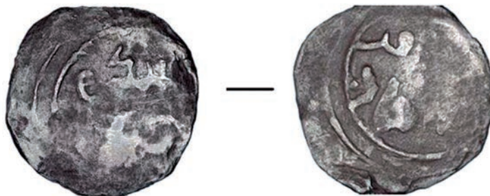
6-сур. Қоныстан табылған тиын.