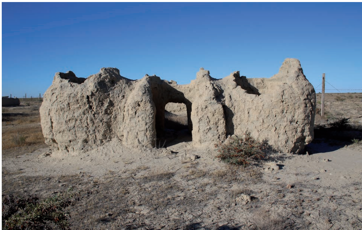
8-сур. Қазақ қорымындағы жерлеу құрылысы. Суретті дайындаған Ж.К. Сұлтанжанов

Бекініс жоспары үшбұрышты келген, көлемі 120×120–220 м айналасына қарағанда биіктеу (1,5–2 м) тегіс төбе түрінде сақталған (4-сур., 1). Оның шығыс бөлігінде тораңғыл бағы мен кейінгі қорым түссе, солтүстік-батыс бөлігінде одан ертерек күйдірілген кірпіштен салынған жерлеу орындары орналасқан. Осы жерде атап өтетін жайт, тораңғыл бағының қоршауы Әбілқайыр ханның ордасы болуы да мүмкін. Себебі, А.И. Макшеевтің айтуынша оның ұзындығы мен ені 50 «саженге», яғни, 90 м-ге тең. Бекініс орнына байланысты осындай екі нұсқа бар. Оның нақты қайсысы бекініс орны болғандығын археологиялық қазба жұмыстары көрсететін болады.