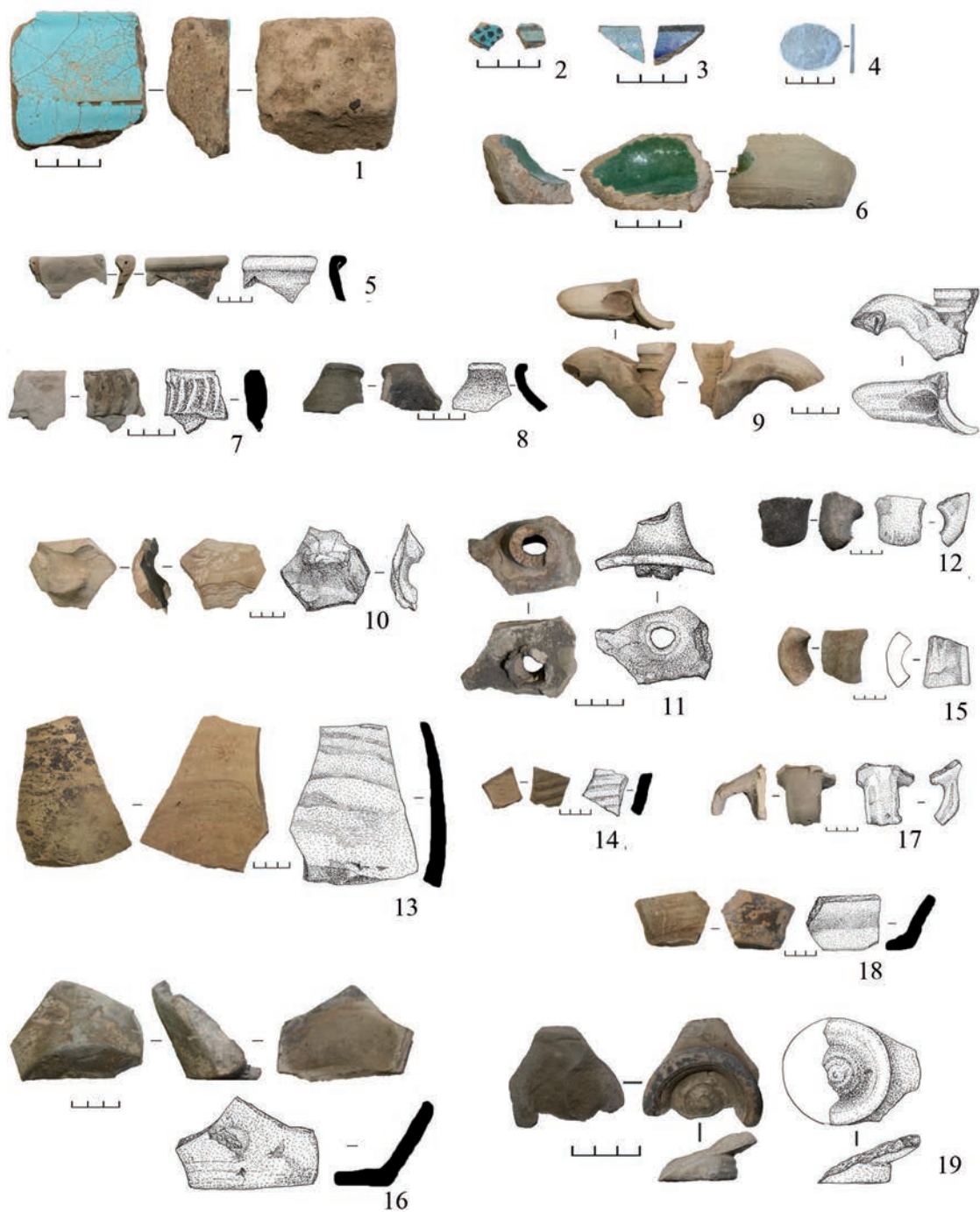
7-сур. Қоныстан жинақталған қыш бұйымдардың сынықтары.

Суретті дайындаған Г.Т. Әмірғалина мен А.Ж. Назаров