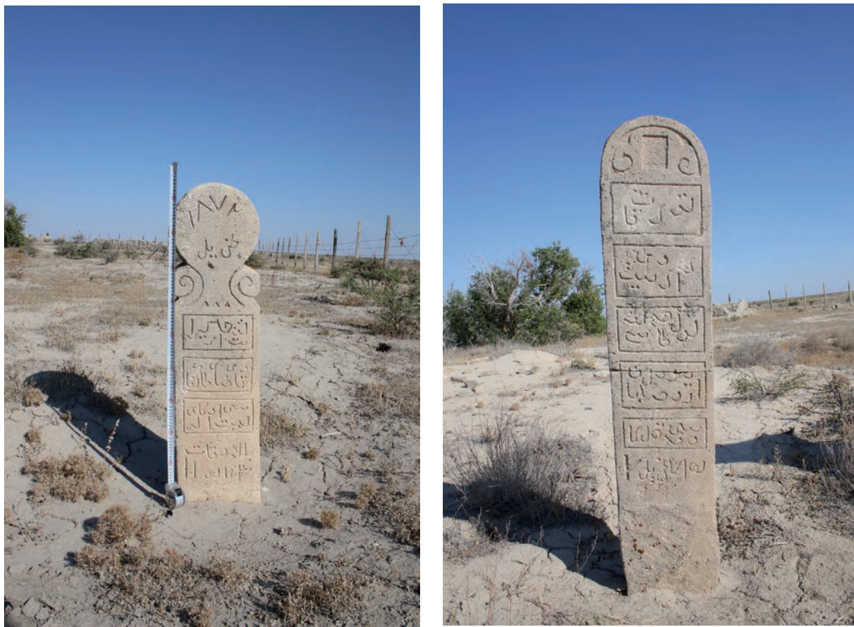
10-сур. XIX ғ. 2 жартысы қазақ қорымындағы (кейінгі қорым) құлпытастар: 1 – № 1 құлпытас; 2 – № 2 құлпытас. Суретті дайындаған Ж.К. Сұлтанжанов