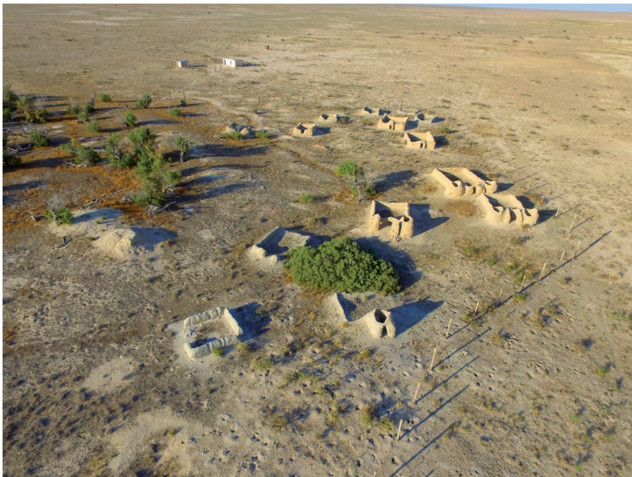
9-сур. XIX ғ. 2 жартысы қазақ қорымы (кейінгі қорым). Суретті дайындаған Ж.К. Сұлтанжанов Fig. 9. Kazakh burial ground built in the second half of the 19 th century. Illustration prepared by Zh. Sultanzhanov Рис. 9. Казахское кладбище, 2-я пол. XIX в. Иллюстрация подготовлена Ж.К. Султанжановым

3. Тораңғыл бағы айналдыра жалпы көлемі 90×90 м, жоспары бес бұрышты ормен қоршалған. Ордың жалпы ұзындығы 400 м. Кіретін қақпасы оңтүстігінде орналасқан (4-сур., 3). Осындай қоршауларды Сырдарияның күріш алқаптарына түсетін ірі қара (жылқы, сиыр) малдарды уақытша қамайтын қора ретінде пайдаланған. Сондай-ақ, қысқа жинаған шөпті сақтау үшін осындай ормен қазылған қоралар болған [Аржанцева, Тәжекеев 2011: 156–163; Arzhantseva, Tazhekeyev 2017: 177–191]. Адам атадағы тораңғыл бағы арнайы егілгендігін осыдан байқауға болады. Яғни, түзде жүрген түйе, жылқы және сиырдан сақтау үшін арнайы ор қазып қоршаған. Бактың ортасында қабырғасы күйдірілген кірпіштерден шеңберлі етіп үйілген жерлеу орны бар. Кейін басына Балхам ата, Адам ата деп жазылған тақта қойылыпты. А.И. Макшеев қорымда «Аудке» бейіті бар деп келтіреді. Жалпы қорымда белгілі бір дәрежедегі тұлға жерленсе керек. Тораңғыл бағы ішіндегі жерлеу орындары XIX ғ. екінші жартысымен мерзімделуі, ал ондағы күйдірілген кірпіштер ерте кезеңдегі кесенелердің кірпіштері болуы мүмкін.