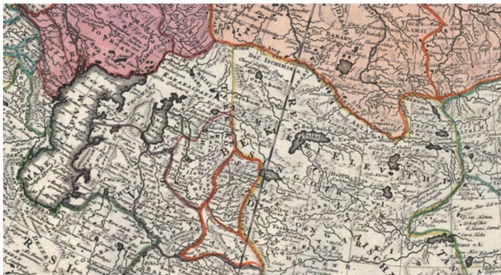
3-сур. 1739 ж. Homann Erben картасы (картада «Chord Golchi» яғни «коргалчи» деп берілген)