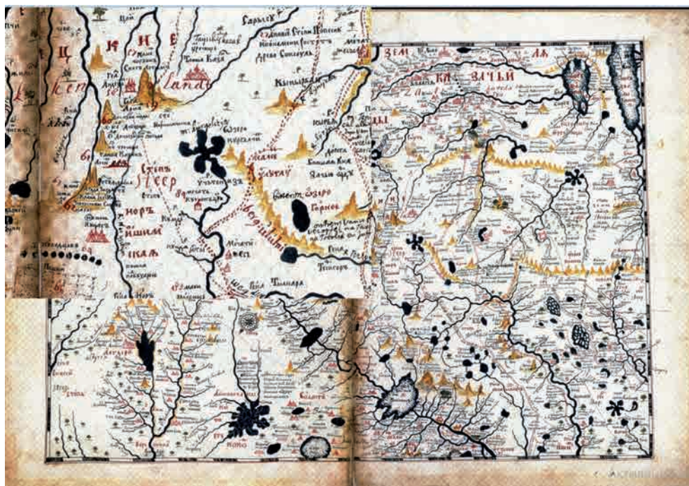
2-сур. Ремезовтың «Чертежная книга Сибири» жылнамасынан алынған Қорғалжын өңірінің картасы (картада Коргалчи көлі мен ескі мешіт белгіленген)