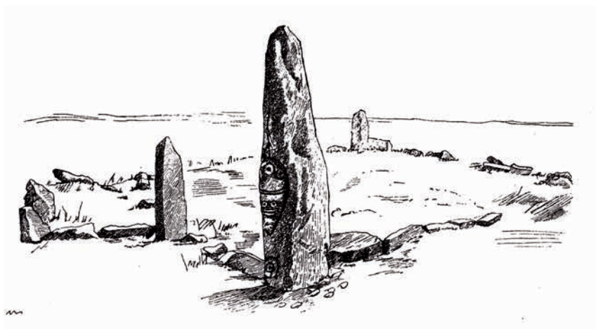
Рис. 2. Тагарская культура. Древнее изваяние в ограде кургана Чалгыс-Оба на р. Уйбат (по: [Appelgren-Kivalo H., 1931, Abb. 294])

Особенно часто изваяния были стоячками (рис. 2), плоские стелы с личинами для этого использовались редко [Вадецкая, 1980, с. 87, № 85; Кызласов Л.Р., 1986, рис. 71, 84, 89–91 и др.; Леонтьев и др., 2006, рис. 2, 28–31, 35–38]. Изредка стелы были стенками ограды и покрытиями погребений [Вадецкая, 1980, № 32, 120; Леонтьев и др., 2006, № 32, 205]. На одном кургане бывает по два, а как-