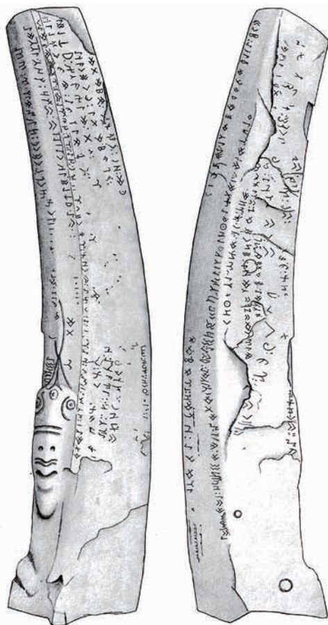
Рис. 7. Первый памятник енисейского письма (Уйбат III, E 32), открытый в августе 1721 г. Надпись перекрывает древнее изваяние (по: Appelgren-Kivalo, 1931, Abb. 156)