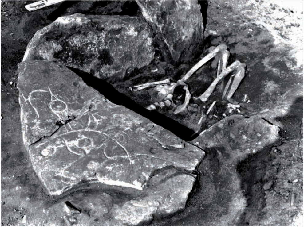
Рис. 1. Окуневская культура. Усть-Бюрь, ограда 5, погребение 1. Обломки стелы с личиной, переиспользованной в качестве перекрытия и стенки каменного ящика (по: [Кызласов Л.Р., 1986, рис. 185])