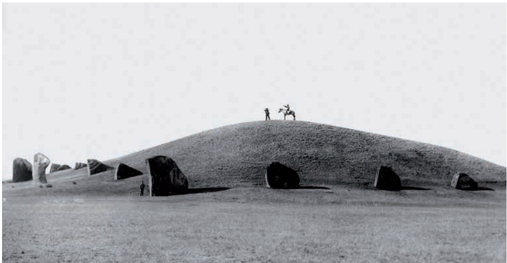
Рис. 3. Тагарская культура. Большой Салбыкский курган. Вид до раскопок, начало XX в. Слева – камни входа.

В таштыкской культуре, открывающей на Среднем Енисее эпоху средневековья, поминальный культ связан с установкой рядами необработанных стел. Каждая из них символизировала окаменевшую душу умершего [Кызласов И.Л., 1975]. Несмотря на это, в таких рядах шесть раз встречены обсуждаемые здесь изваяния [Леонтьев и др., 2006, № 9, 54, 78, 160,