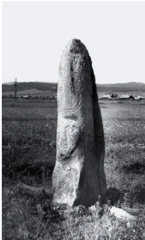
Рис. 9. Изваяние № 5 ввиду поселка Ербинское. За домами руины храма. 1971 г.

теля, произведшего археологическое изучение обоих до того невиданных культурных явлений [Кызласов Л.Р., 1999, с. 181].