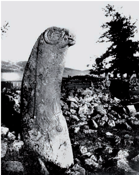
Рис. 6. Древнее изваяние на кургане Усть-Бюрьского (Чамакского) чаатаса.

В этой небольшой межгорной долине в разное