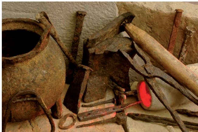
Рис. 4. Талгар. Чугунный котел, инструментарий кузнеца и готовые изделия.