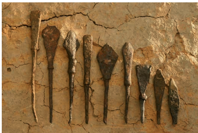
Рис. 3. Талгар. Наконечники стрел.

Основная суть метода заключается в измерении содержания изотопа углерода в органическом образце. Как известно, на Земле фиксируются три изотопа углерода: ^{12}\text{C} , ^{13}\text{C} и ^{14}\text{C} – все в различных концентрациях. Изотоп ^{14}\text{C} присутствует во всех живых организмах, его уровень всегда равен уровню, существующему в природе. После прекращения жизнедеятельности организма активность радиоуглерода в нем уменьшается. Отсюда легко рассчитать возраст образца по оставшейся на момент измерения активности углерода ^{14}\text{C} [Дергачев, 1994, с. 13].