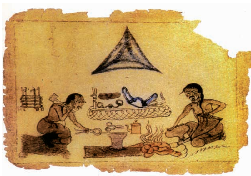
Рис. 1. Тюркские кузнецы. Средневековая китайская акварель

Население городов Северо-Восточного Жетысу состояло из представителей тюрко-язычных племен – карлуков, уйсун, чигилей. Неоспорим и факт проживания наряду с перечисленными племенами пришлых согдийцев, китайцев и киданей [Байпаков и др., 2005, с. 98] (рис. 1).