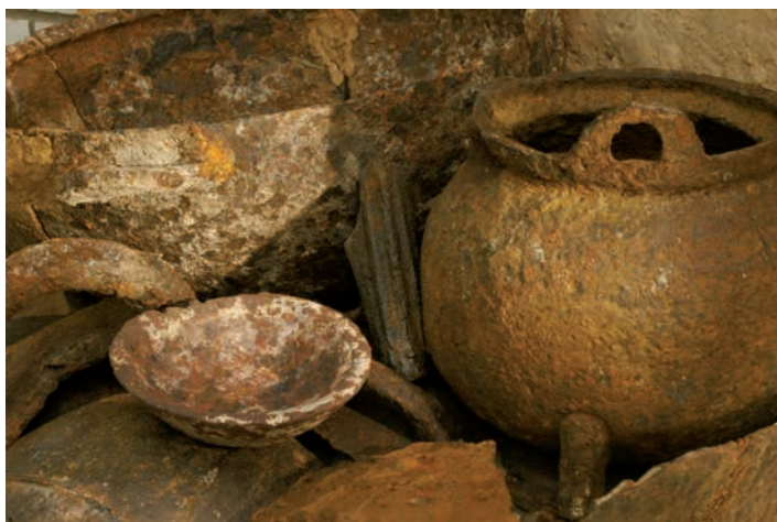
Рис. 5. Талгар. Чугунные изделия.

Большинство изделий из железа и стали произведены методомковки. Чугунные изделия не имели широкого применения в силу специфических свойств металла, они представлены в коллекции отдельными видами посуды (котлы, сковороды, жаровни) и лемехами. Тем не менее, очевидно, что плавка чугуна являлась важным элементом местного производства в период средневековья (рис. 5).